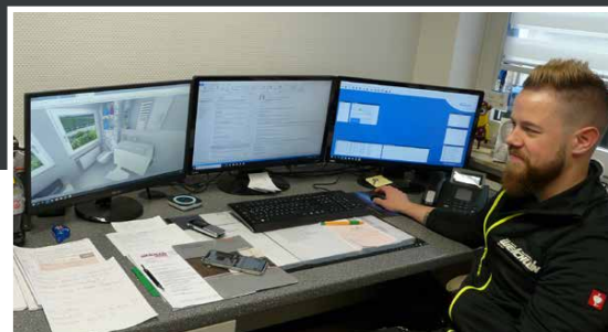
3D-Badplanung gehört zum Standard